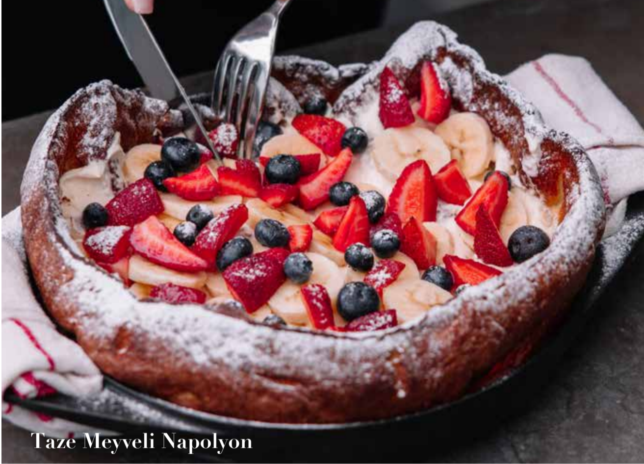
Taze Meyveli Napolyon

Tek göz yumurta, Hellim peyniri, Lutenitsa, Dana Sosis / Domuz Sosis, yeşillik, Cherry Domates