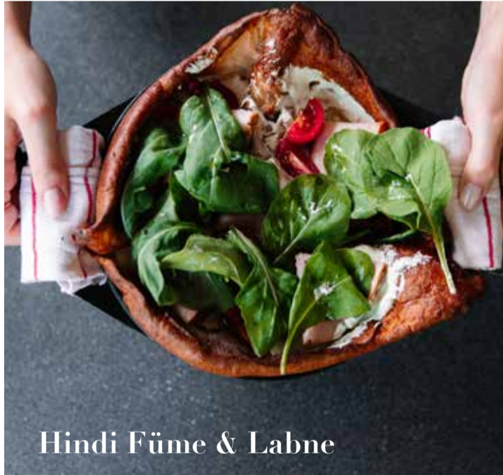
Hindi Füme & Labne