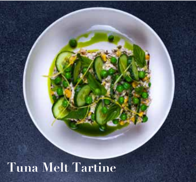
Tuna Melt Tartine