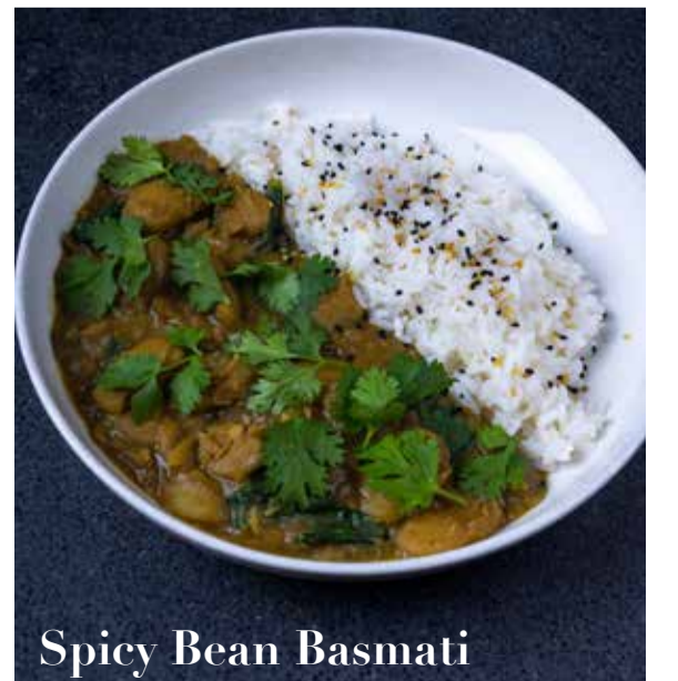
Spicy Bean Basmati