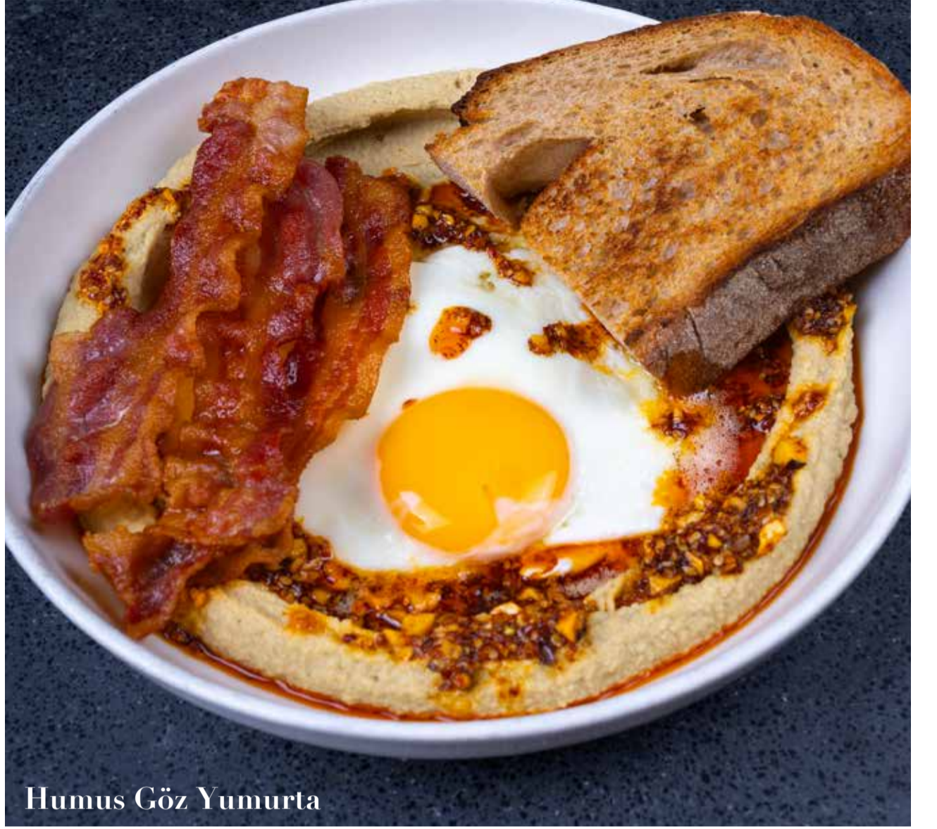
Humus Göz Yumurta

Karabuğday pancake, muhammara, kızarmış tofu, köy biberi, yeşillik, cherry domates