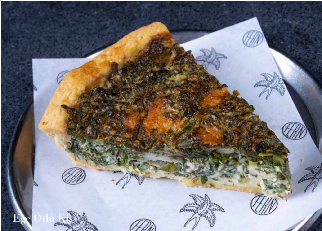
Ege Otlı Kis