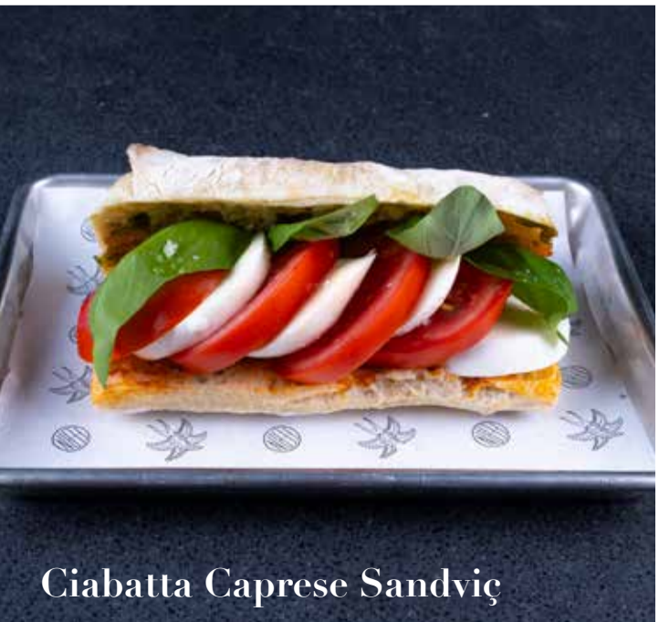
Ciabatta Caprese Sandviç